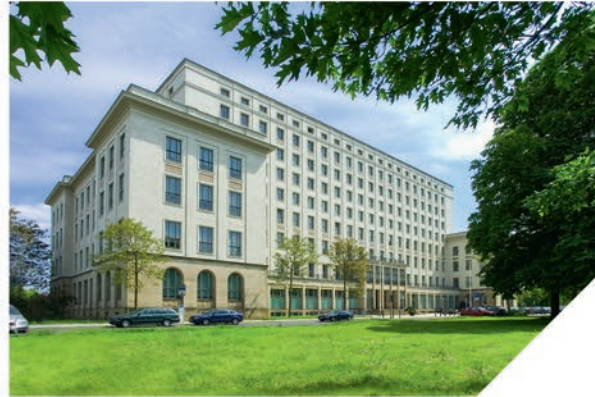
Zentralgebäude der HTWD

Die Absolventen sind für sämtliche Ingenieur Tätigkeiten in Industrie, Forschung, bei Dienstleistern und öffentlichen Einrichtungen qualifiziert. Die vielfältigen Einsatzmöglichkeiten eröffnen überdurchschnittlich gute Berufschancen in einem begehrten Arbeitsmarkt, wie z.B. der Chipindustrie.