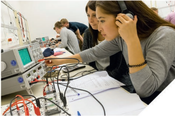
Praktikum im Labor Grundlagen der Elektrotechnik