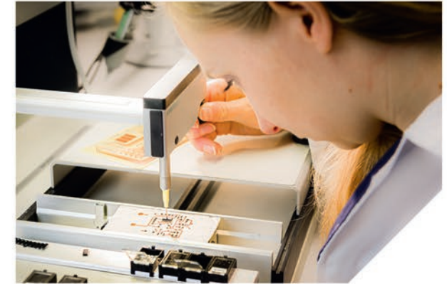
Bauelemente-Bestückung einer biobasierten Leiterplatte