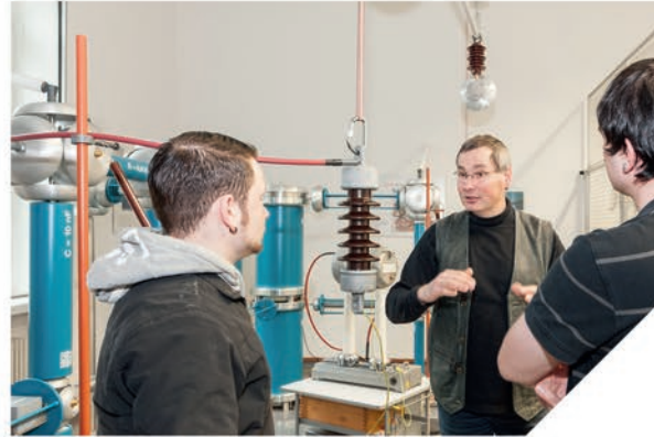
Hochspannungslabor der Fakultät