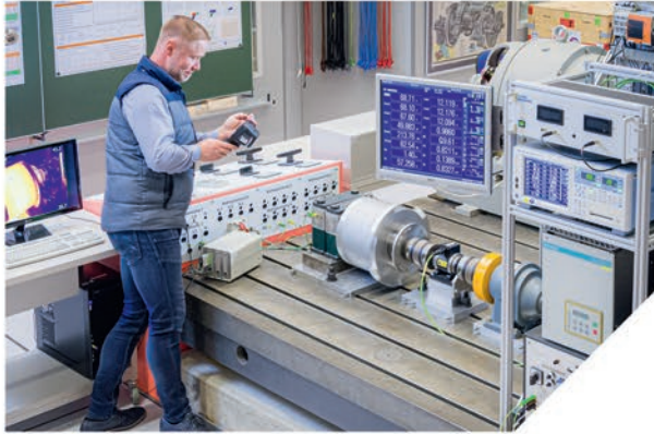
Untersuchung des Erwärmungsverhaltens eines Windenergiegenerators

Eine hoch verfügbare, nachhaltige Elektroenergieversorgung und effiziente elektrische Antriebe sind eine Grundlage technischen und gesellschaftlichen Fortschritts.